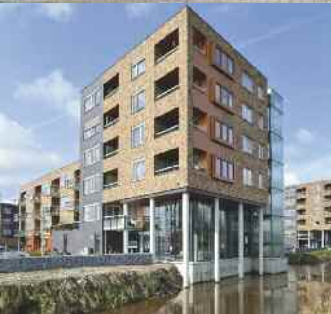
Architectuurimpressies van de nieuwe Dichtershof waar in de hele wijk consequent drie materialen gebruikt werden: oranje geschakeerd metselwerk, bruin-zwart metselwerk en koperkleurige trespa-plaat.