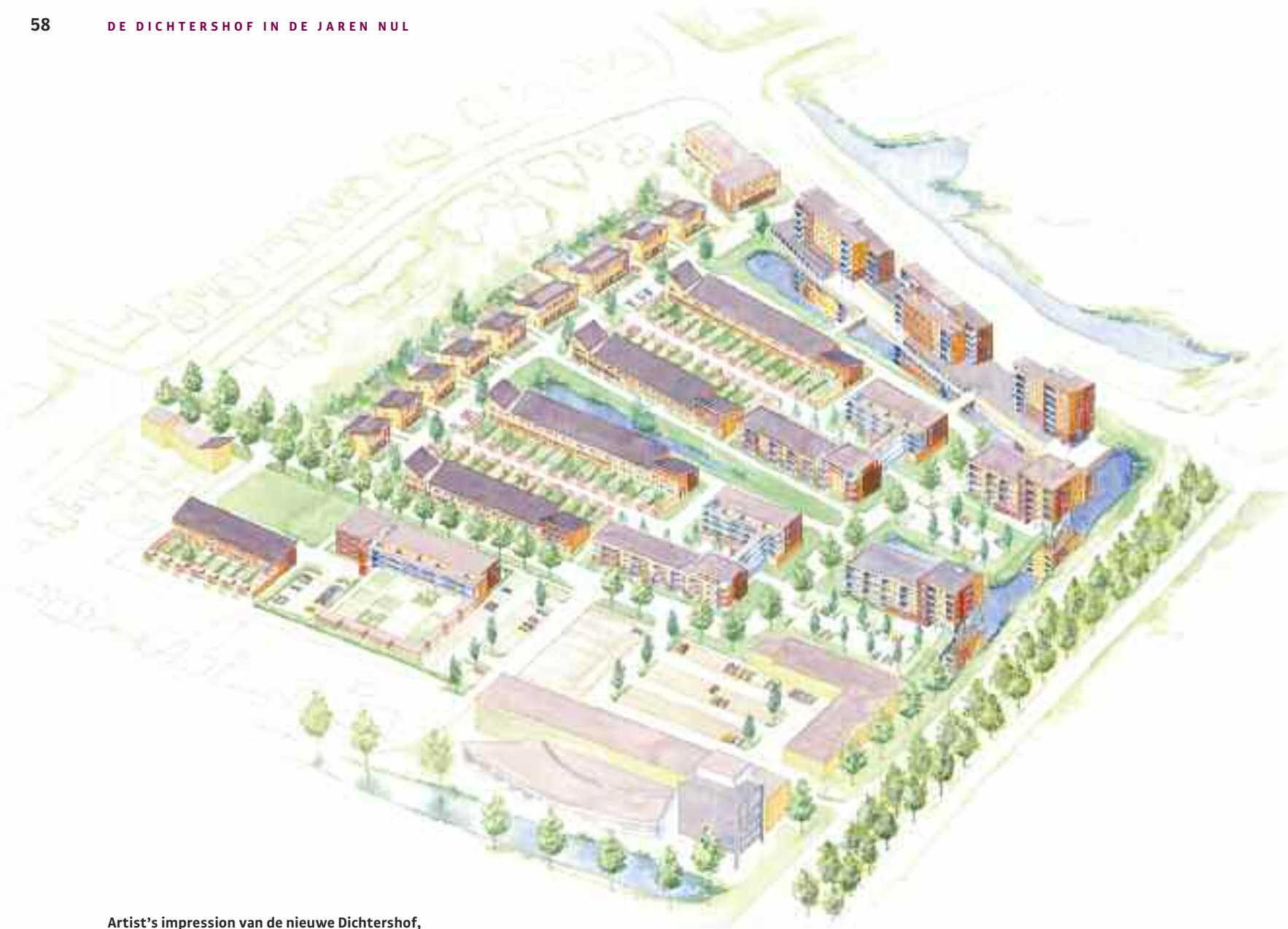
Artist's impression van de nieuwe Dichtershof, een aquarel van Silvana Kok van KAW.