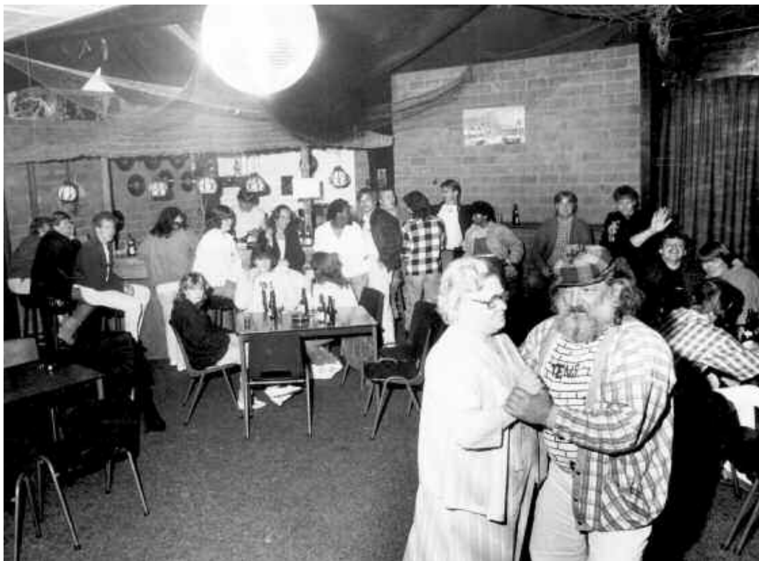
Feest in het buurthuis in de Dichtershof, midden jaren tachtig.