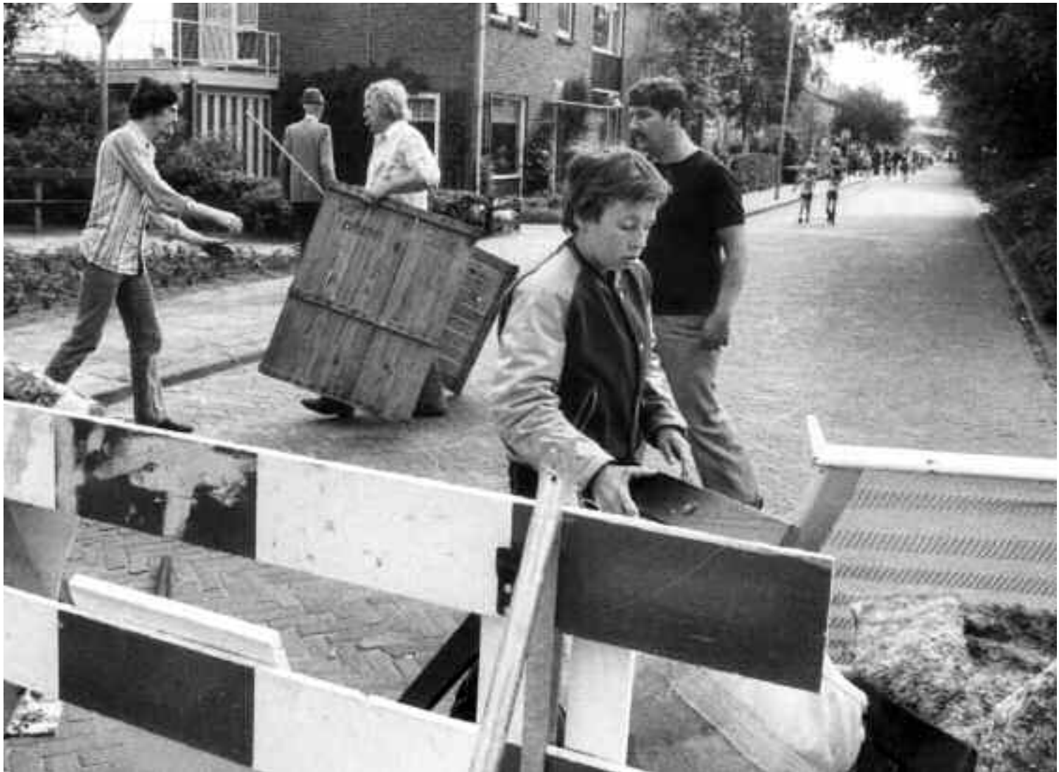
Op 7 juni 1980 sloot de buurt met barricades uit protest de Jacob Catslaan af.