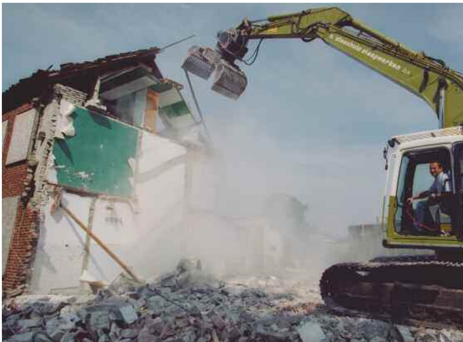
Bert Huizing, manager Wonen van de SWA, maakte in augustus 2003 een begin met de sloop van het laatste blok huizen in de Dichtershof.