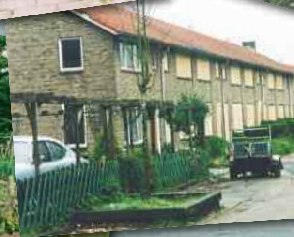
Troosteloze beelden van de Dichtershof, de laatste dagen vlak voor de sloop.