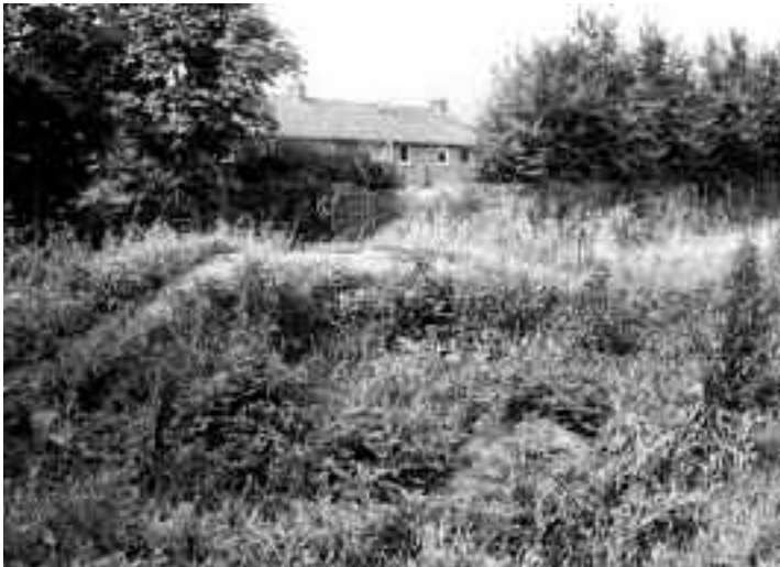
De plek waar het buurthuis moest komen, lag er in het voorjaar van 1978 nog woest en verlaten bij.

Pas eind 1979 kwam er schot in de zaak en in april 1980 werd de eerste schep in de grond gezet. Dat gebeurde door de buurt zelf, men was het wachten zat. De gemeente weigerde om voor een extra bedrag van 50 duizend gulden garant te staan en dat terwijl de ISP-toezegging zou aflopen als er niet voor oktober met de bouw begonnen was.