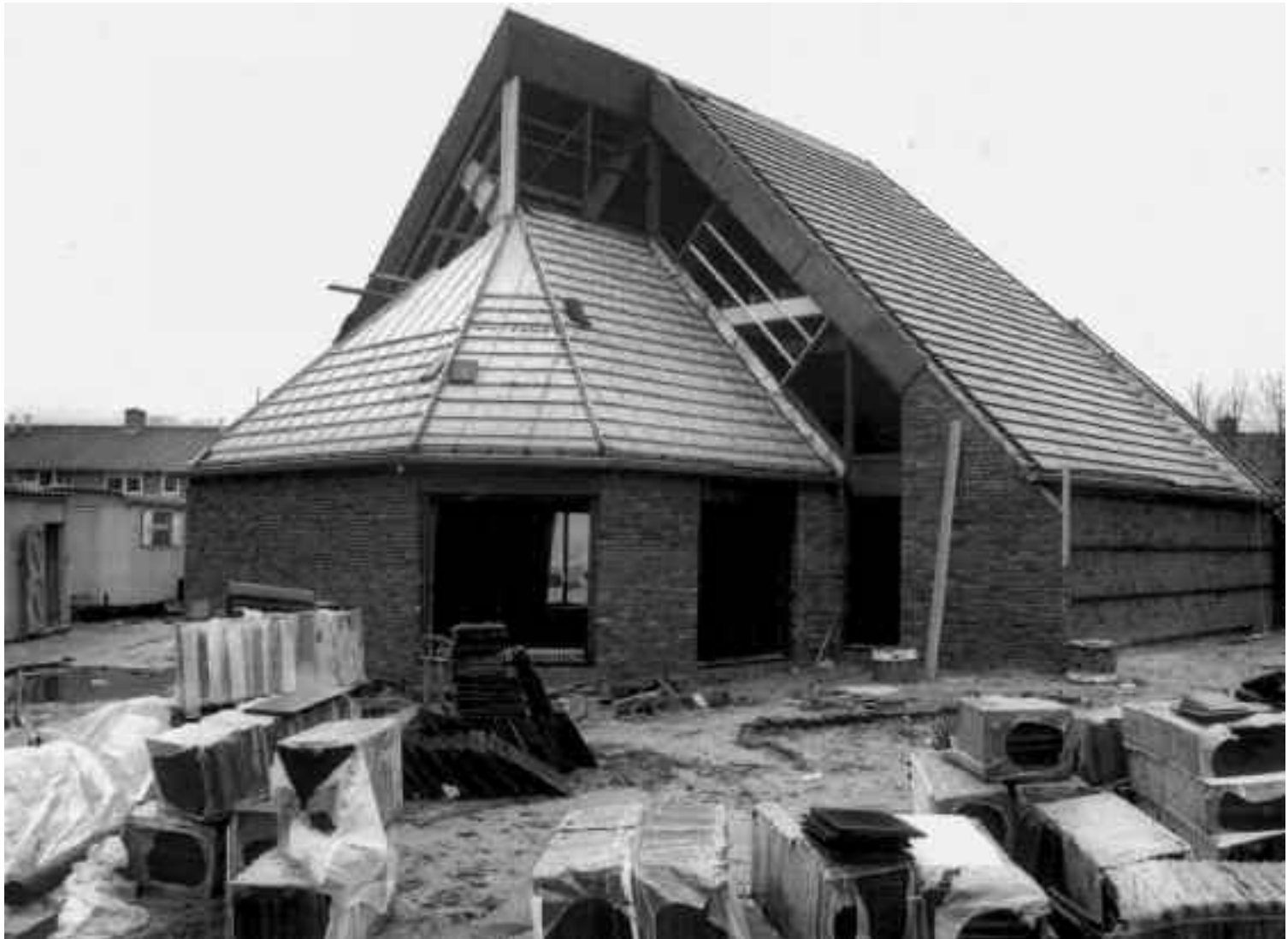
Buurthuis de Dichtershof in aanbouw in het voorjaar van 1981.