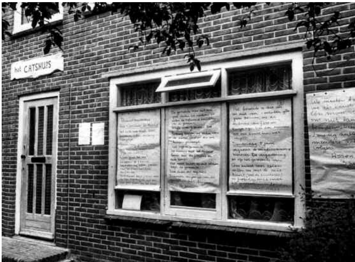
Met een lang bulletin plakte het bestuur van de Buurt- en Belangenvereniging Dichtershof op 3 juni 1980 de ramen van het Catshuis dicht.