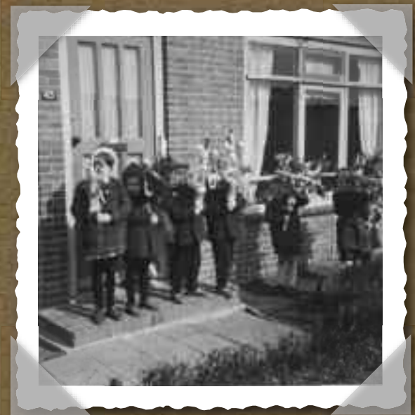
Foto's uit het album van de familie Stel: wonen in de Dichtershof eind jaren vijftig.