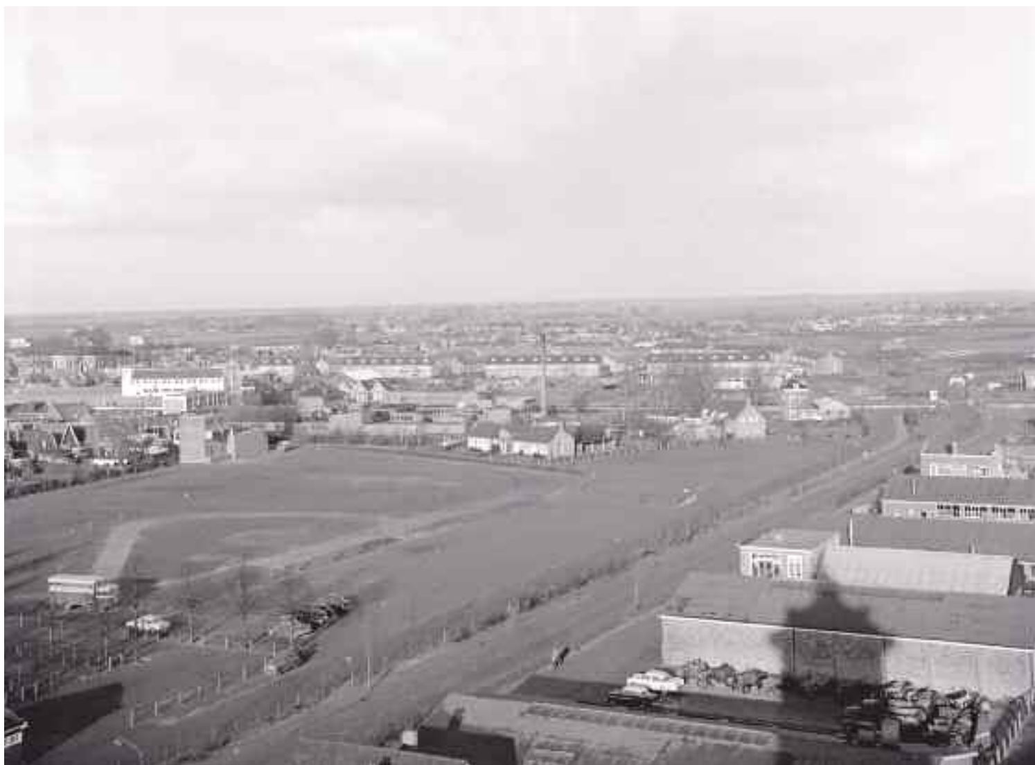
Uitzicht vanaf de oude watertoren (schaduw!) aan het spoor bij de Rolderstraat eind jaren vijftig. Achter het slachthuis (schoorsteen) ligt de dan gloednieuwe buurt de Dichtershof. Het witte gebouw links is Stork Pompen.