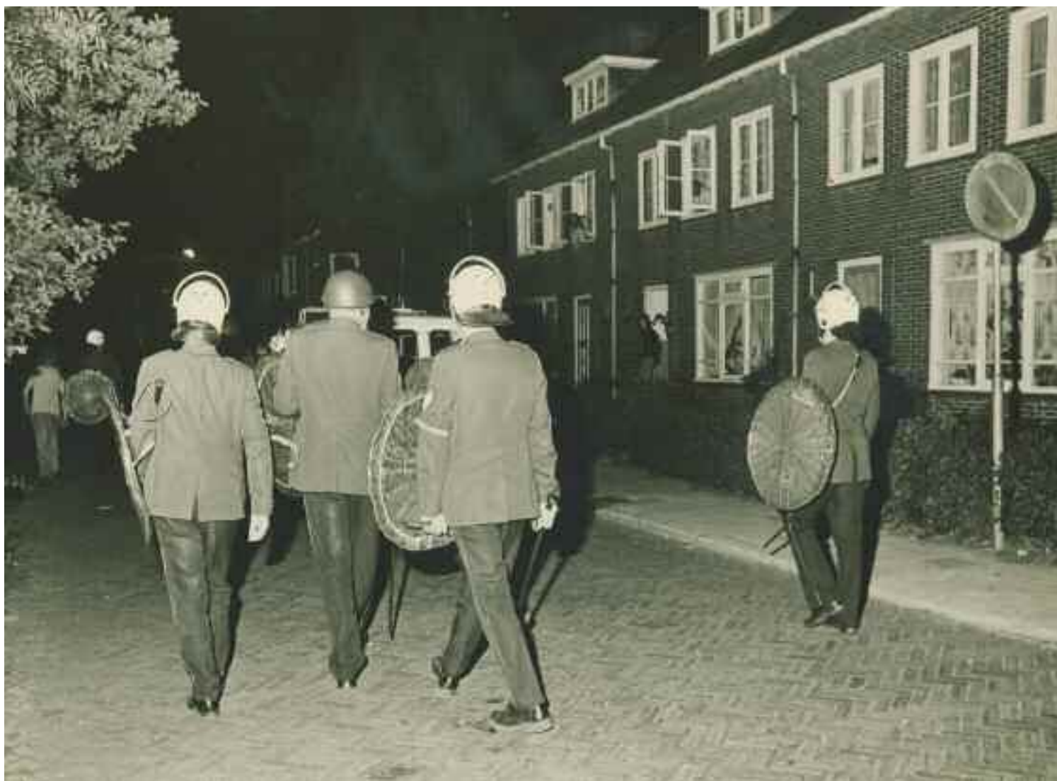
Optreden van de Mobiele Eenheid in de Dichtershof in juni 1976.